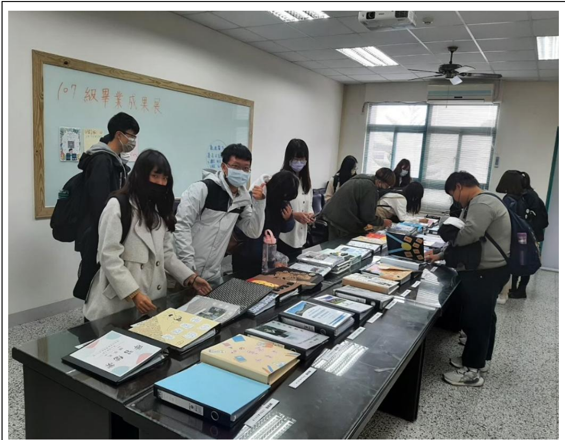
每一本成果冊都是付出時間與心力所誕生的青春結晶