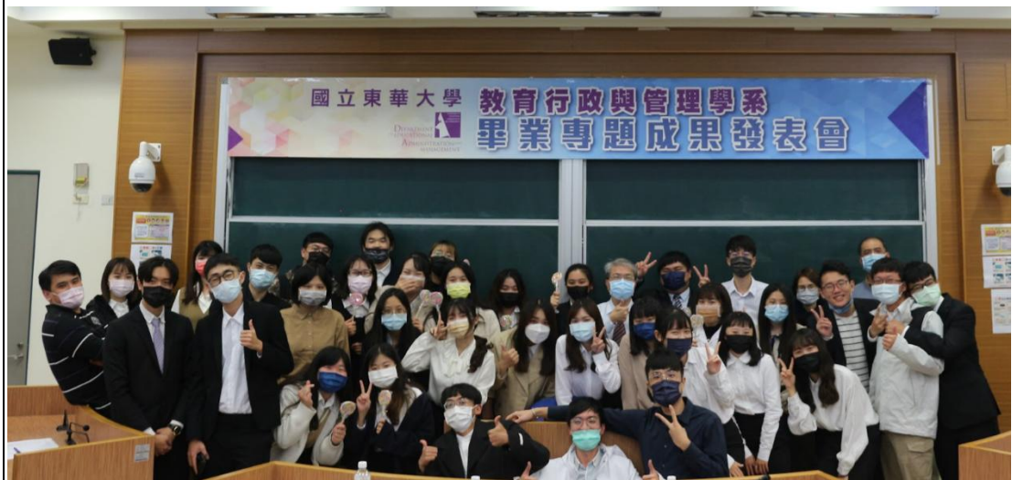
謝謝辛苦的所有夥伴們～我們未來職場再相遇！