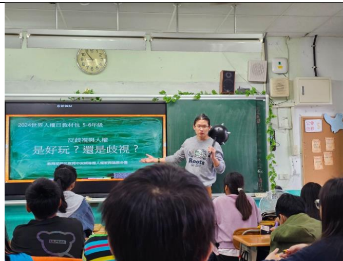
你知道，有的時候流星錘比嘴巴還好用