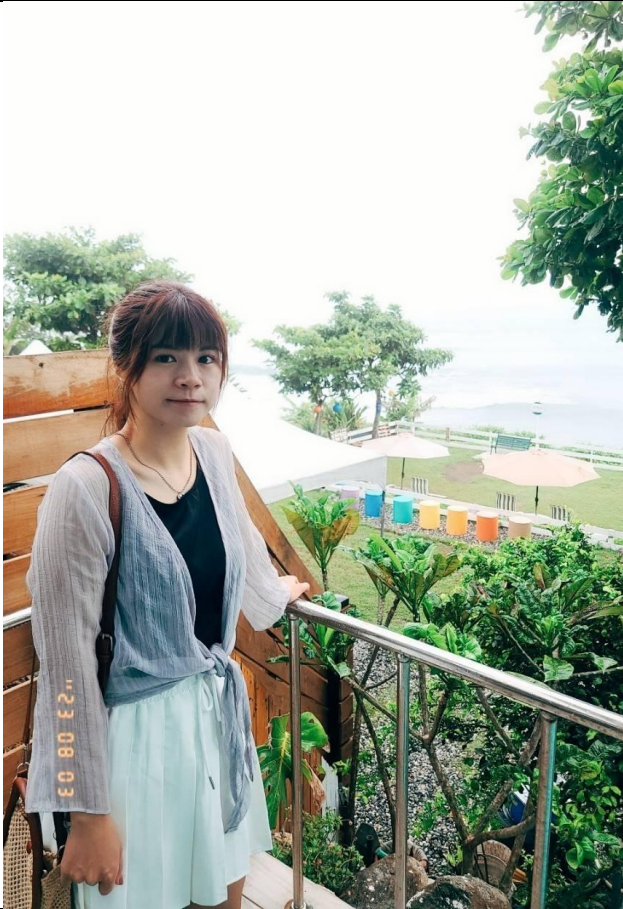
把酒祝東風，且共從容