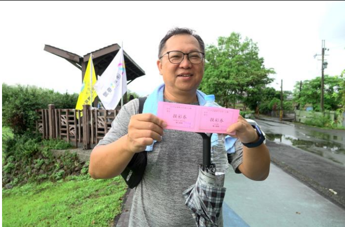
人生最首要的是樹立一個宏遠的目的.並下定決心去實踐它