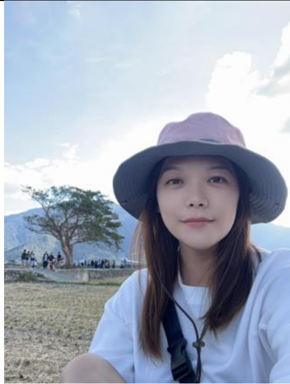
如果不想被打倒，只有增加自身的重量，大家一起去吃火鍋吧!