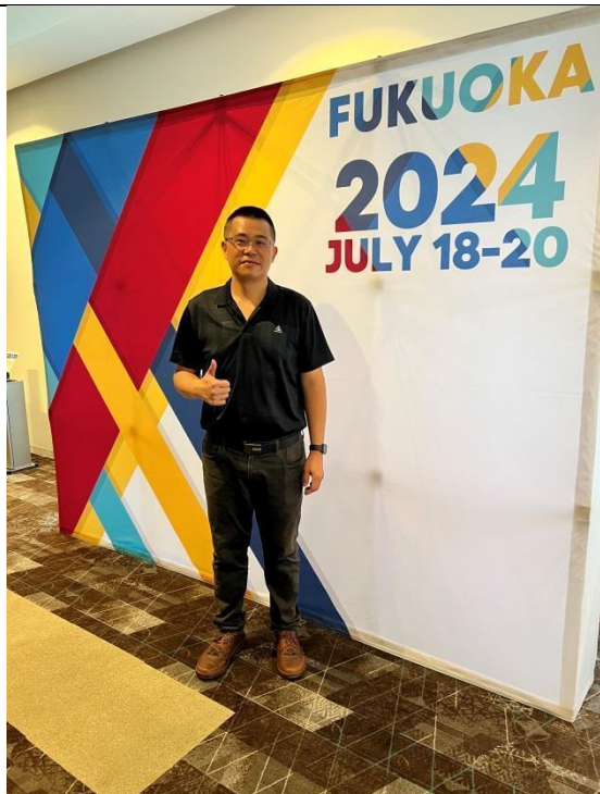
凡走過必留下痕跡；享受生活，生活享受