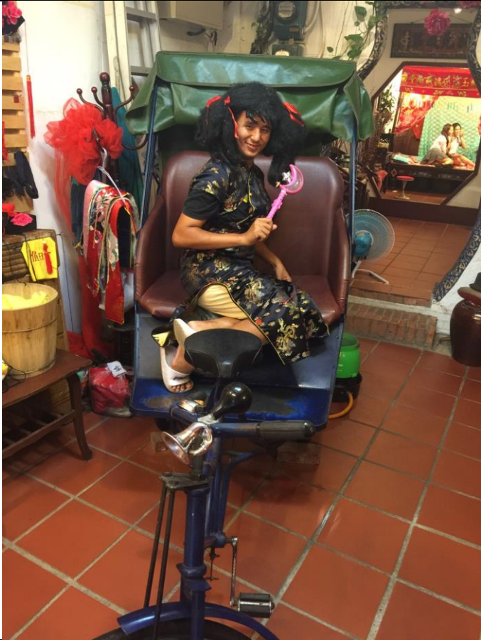
誰說旗袍下不能是男的？ 我還拿仙女棒加爆炸頭勒。