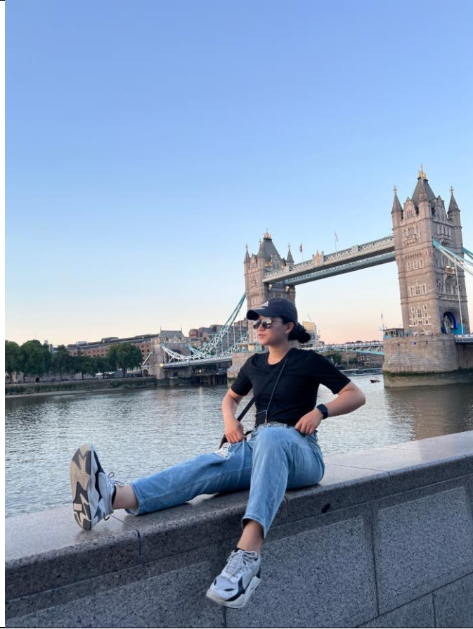
East or west, food is the best. With coffee in hand, life is a zest.