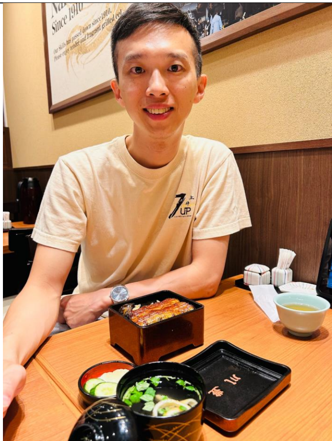
勇敢追逐、築夢踏實