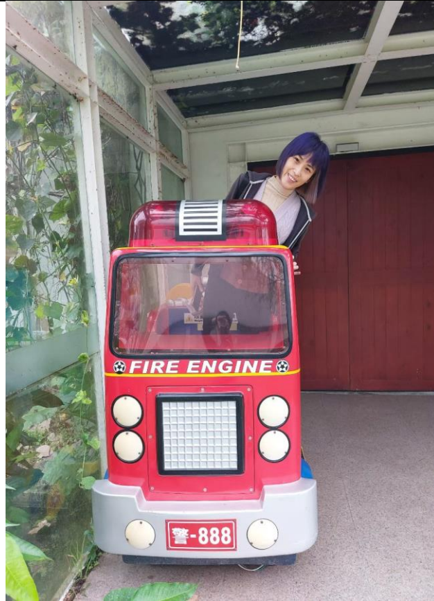
不管怎麼樣，大人不過就是長大了的小孩