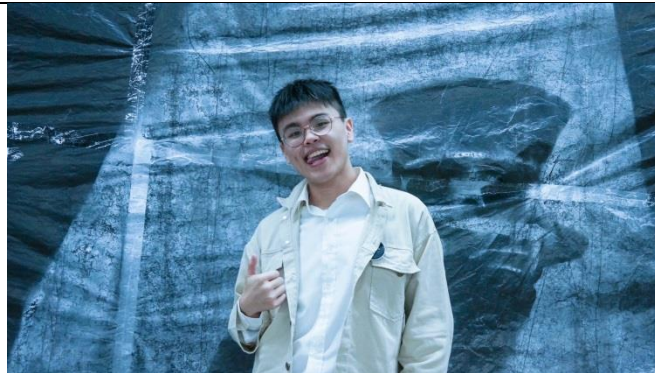
是與非，對與錯，黑與白，全錯就是全錯