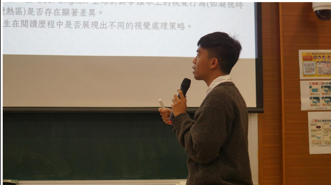
同學們自信且享受上台發表的機會與喜悅