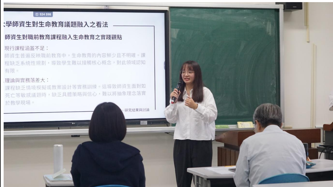
老師們認真聆聽並給予意見指導