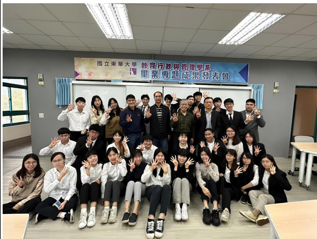
謝謝所有辛苦的夥伴們～祝所有大四畢業生「四四」順利！