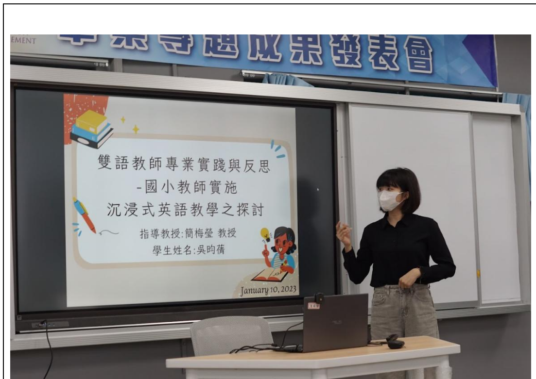
同學們針對雙語教師專業實踐之研究進行分享